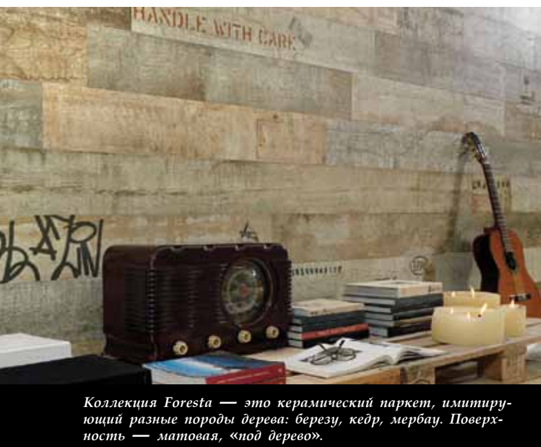
Коллекция Foresta — это керамический паркет, имитирующий разные породы дерева: березу, кедр, мербау. Поверхность — матовая, «под дерево».

— В России марку Peronda знают уже более десяти лет, и сейчас она является одной из самых известных и популярных. Коллекции керамической плитки и керамогранита Peronda выполнены в самых различных стилях: этнические — Tokyo, Damasco, классические — Museum, Art, современные — Memphis, Banksy. Практически каждая коллекция представлена в нескольких оттенках: бежевом, белом, черном, сером, коричневом.