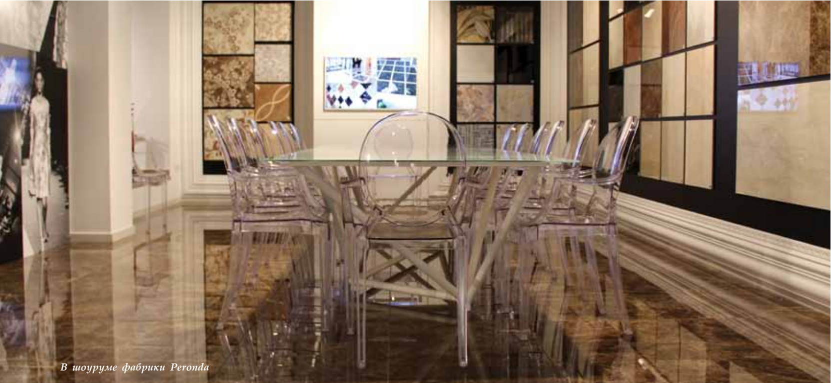
В шоуруме фабрики Peronda

Что я открыла для себя нового? Это — сантехника Peronda. Очень красивые раковины из натурального камня (оникса, гранита, мрамора) в виде чаш. Во многих изделиях просматриваются окаменелые моллюски, ракушки. Ты понимаешь, что это уже больше чем раковина, это — частичка вековой истории Земли. Настоящий эксклюзив!