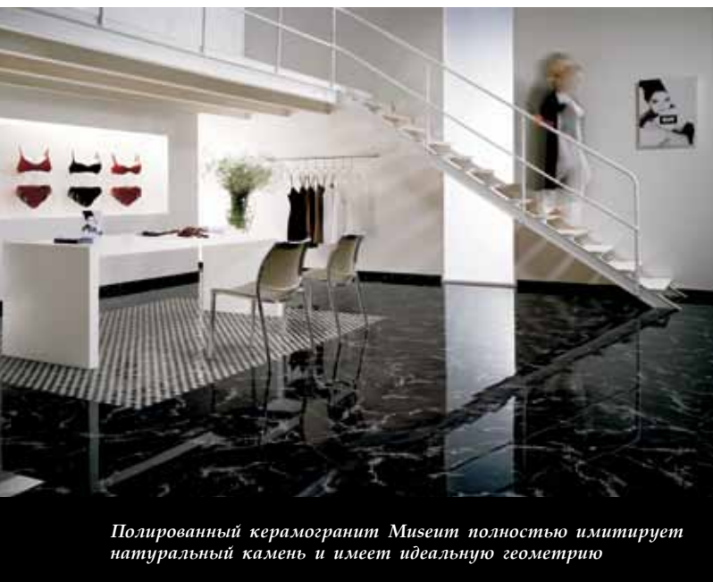
Полированный керамогранит Museum полностью имитирует натуральный камень и имеет идеальную геометрию