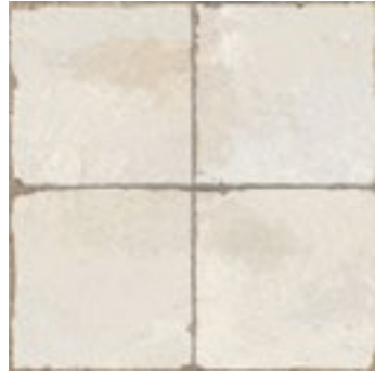
13305 FS-0 BN14 (45x45) (4-1-H)**** CLASE1 R-9 13 gráficas/patterns