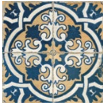
12501 FS-2 BN14 (45x45) (5-1-H)**** CLASE1 R-9 9 gráficas/patterns