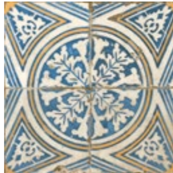
12500 FS-1 BN14 (45x45) (5-1-H)**** CLASE1 R-9 10 gráficas/patterns