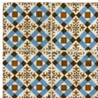
12541 FS-4 BN14 (45x45) (5-1-H)**** CLASE1 R-9 5 gráficas/patterns