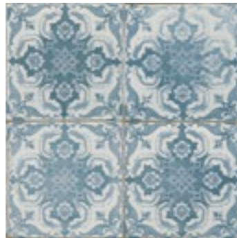
12519 FS-3 BN14 (45x45) (5-1-H)**** CLASE1 R-9 8 gráficas/patterns